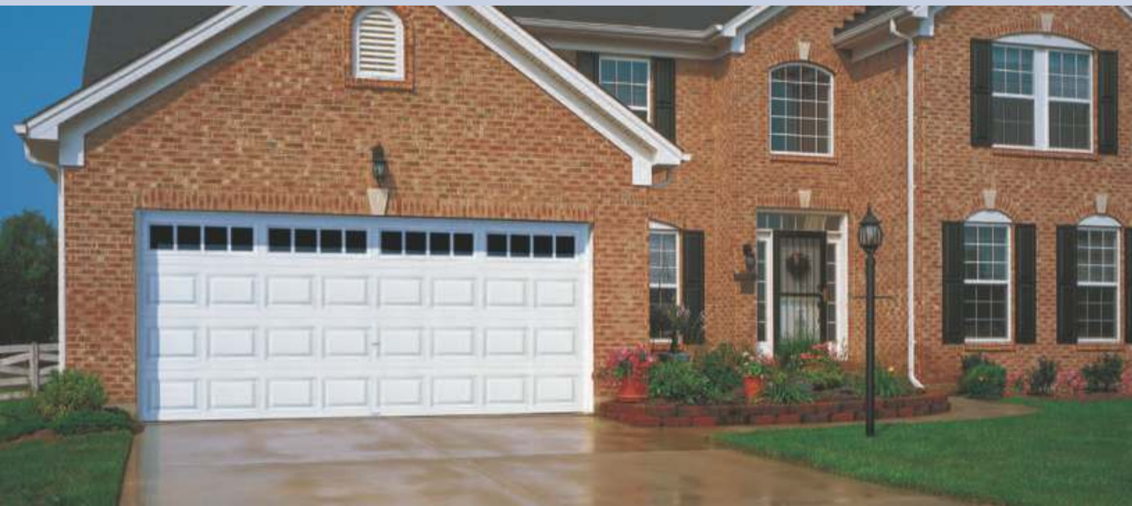
Modelo 4053, diseño de panel Elegante largo con ventana opcional diseño Sunset 601.